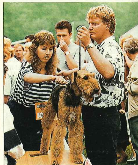
Před výstavou je potřeba provést pečlivě poslední úpravy srsti. Správná a dle standardu provedená úprava srsti může vyzdvihnout přednosti každého jedince