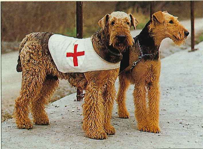
Erdelteriéři se používají také při záchrannářských pracích

řády pořádá klub závody. V současné době existuje řád pro udělení titulu Junior a Senior Hunting Dog (Mladý a dospělý lovecký pes) ve vyhánění zvěře (JHDF a SHDF), v přinášení (JHDR a SHDR) a nejtradičnější jsou zkoušky z lovu kožešinových zvířat (JHDFur a SHDFur). Psi musí zvednout pernatou zvěř ze země, zastřelenou přinést z pole a vody, popřípadě sledovat stopu kožešinové zvěře, nalézt ji a vyštěkat či vystavit. Členové výboru pro lov a práci spolupracují s loveckými rozhodčími a instruktory i pro ostatní plemena a snaží se o to, aby Americký kennel club uznával lovecké tituly i erdelteriérům.